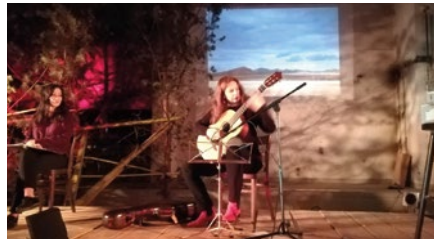
© EUROM | Assaig general 2018

Música: Nora Buschmann i Rex Joswig - Herbst in Peking! Textos: Ines Burdow Imatges: Robert Conrad Producció: Margrit Kühl Realització: EUROM-European Observatory on Memories i Fundación Muro de Berlín (Stiftung Berliner Mauer) , amb el suport de l' Ajuntament de Barcelona i del programa Europe for Citizens de la Comissió Europea.