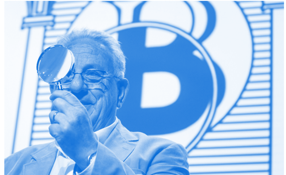
Lliurament del II Premi Borni als lectors 2015.

Consulteu les bases del III Premi Borni al nostre web: www.elborncentrecultural.cat